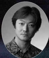
ドロッセルマイヤー