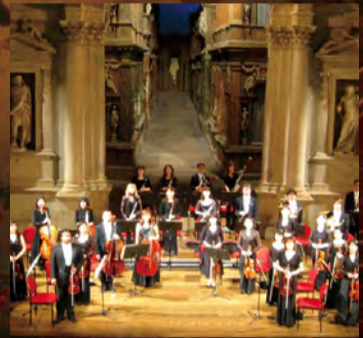
ロイヤルチェンバーオーケストラ