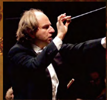
ダニエレ・アジマン (指揮)