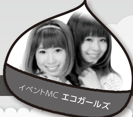
イベントMC エコガールズ

大阪府の最北端(てっぺん)にある能勢町で、子供から大人まで、来て・見て・食べて・楽しむ“お祭り”を開催します!!